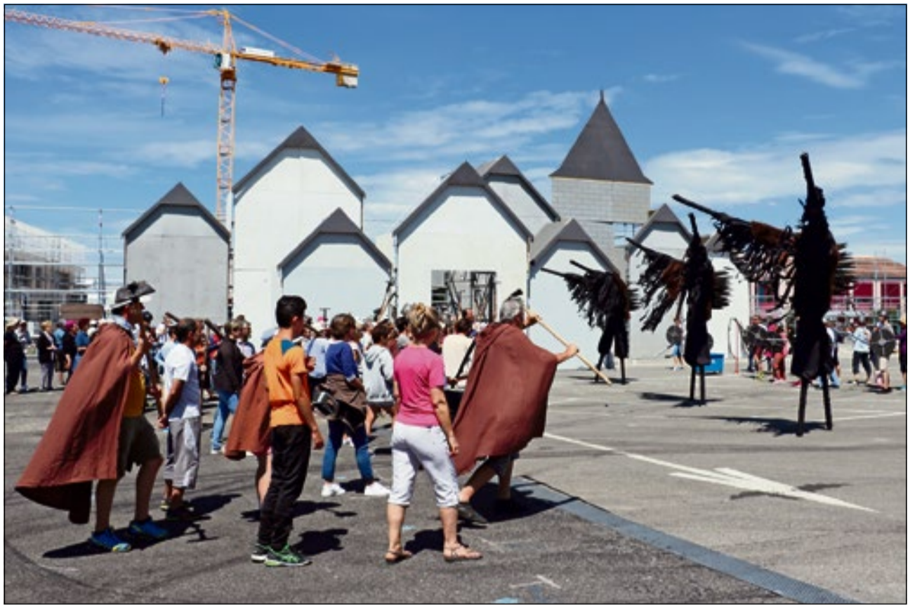
Futur lieu du spectacle Solstices, la place Court Champ à Echallens accueille désormais les répétitions.