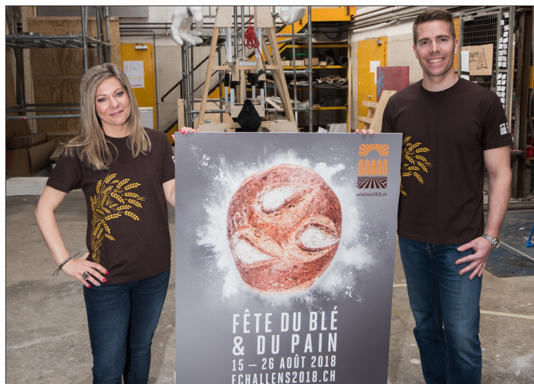
L'affiche 2018 portée par deux bénévoles habillés du nouveau t-shirt.