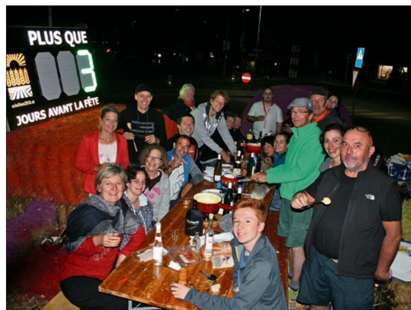
Les figurants du spectacle ont fêté dimanche soir la fin des répétitions sans public en dégustant une fondue... à côté du compte à rebours installé à l'entrée d'Echallens.