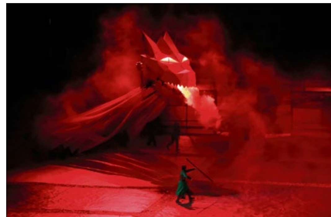
Aurore défiant seule l'impressionnant dragon apparaissant à la fin du spectacle.