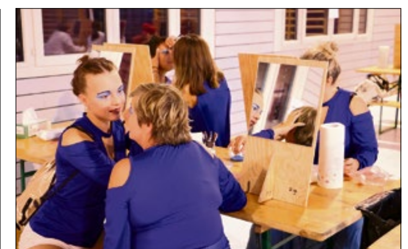
Les figurants de l'eau s'entraînent lors de la séance de maquillage.