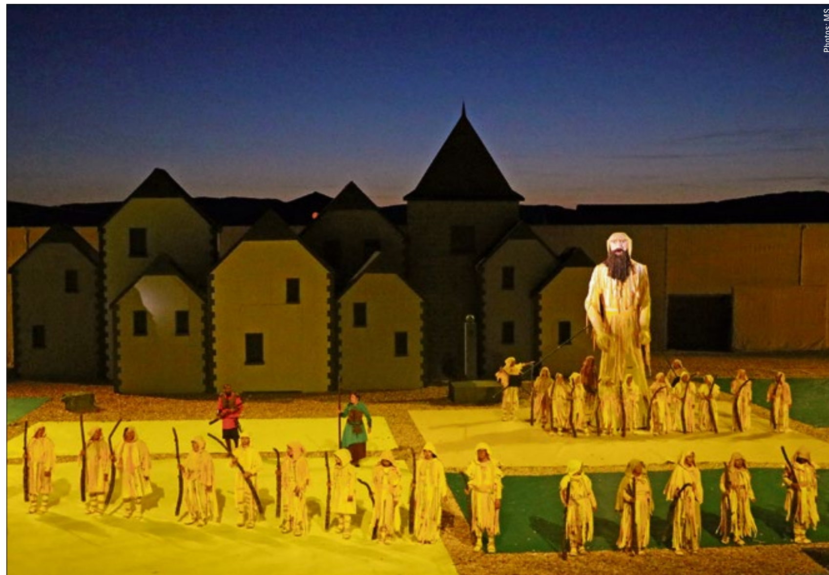
Animé par quatre manipulateurs, le troll symbolise le travail de la terre.